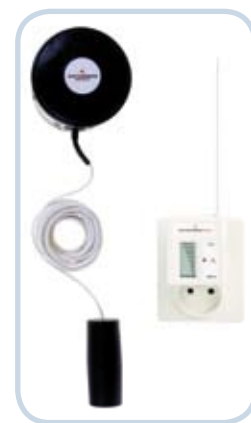
Czujnik poziomu i przecieku WatchmanSonic Plus